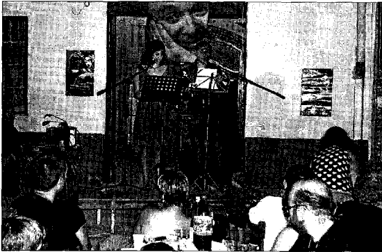
Recital de los versos de Estellés en Quart de Poblet.